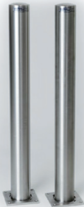
Poller mit Bodenplatte Außen Ø 76, 89, 104 mm