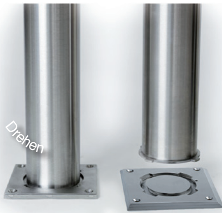
Mit Drehverschluss bei Bedarf absperrrbar