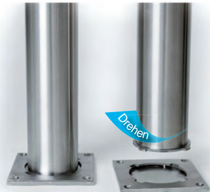
Bodenplatte mit Drehverschluss bei Bedarf absperribar

*Geprüfte Absturzsicherung ZT DI Othmar Pfügl, 4600 Wels GZ 23/12 - 04/13 - 05/13